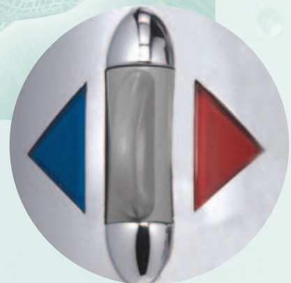
Übersicht der Mischbatterie