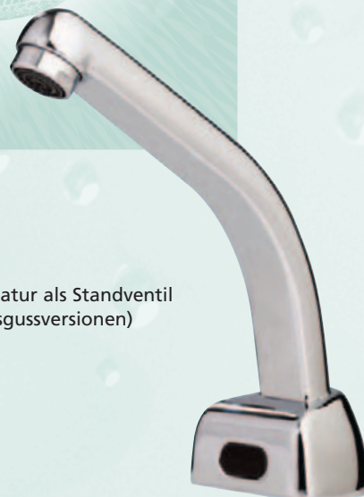
Modularmatur als Standventil (3 Ausgussversionen)