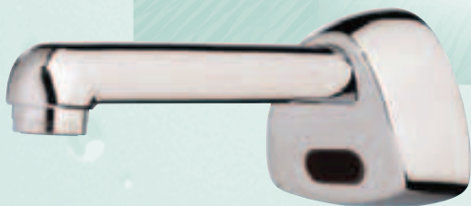
Modularmatur mit Wandbefestigung (3 Ausgussversionen)