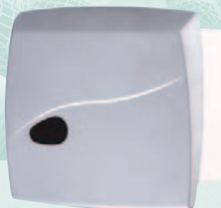
UP Urinalarmatur (gibt es in elfenbeinfarbener Epoxydharzausführung)